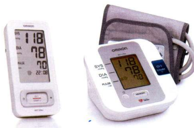
Рисунок 1 – Общий вид ИАД автоматических, для измерений на плече

Общая схема пломбировки и маркировки – на рисунке 5.